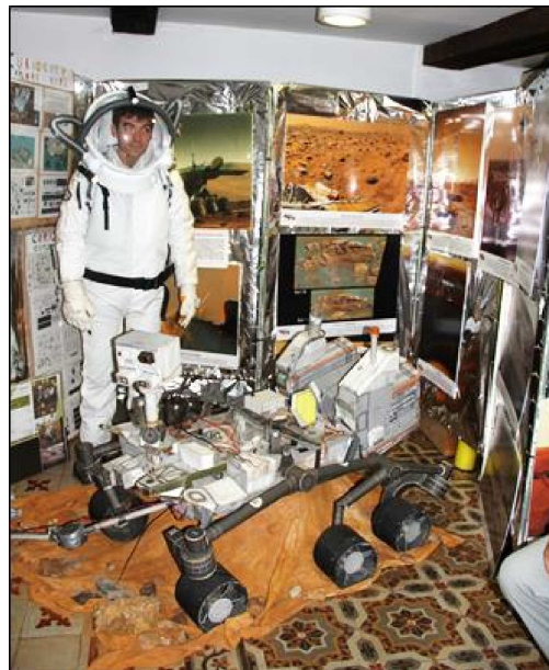
Un cobaye en scaphandre APM.