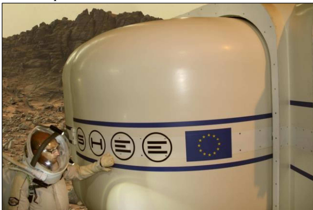
Le prototype SHEE d'habitat planétaire à secteurs déployables et le scaphandre de simulation APM.

nouveau scaphandre de simulation Gandolfi 2 de la société.